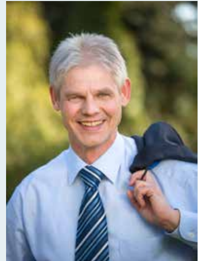
FRANK KLINGEBIEL Oberbürgermeister der Stadt Salzgitter